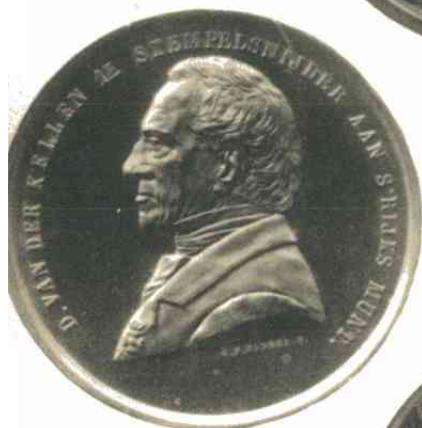
n o . 342.