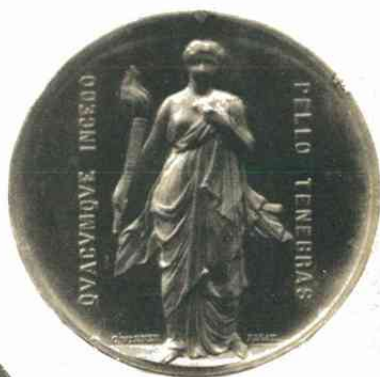
n o . 359.