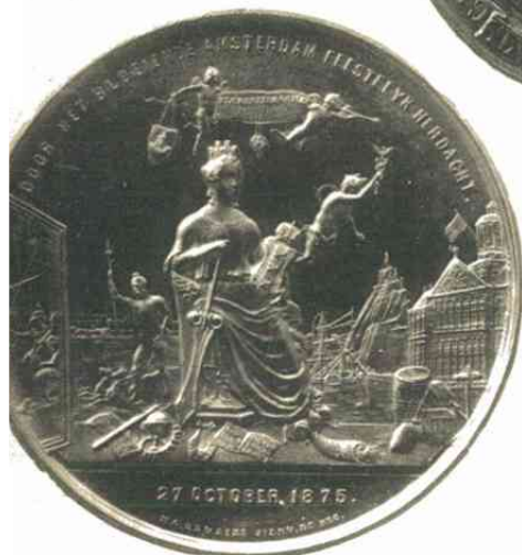
n o . 374.