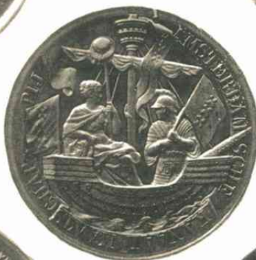
n o . 395.