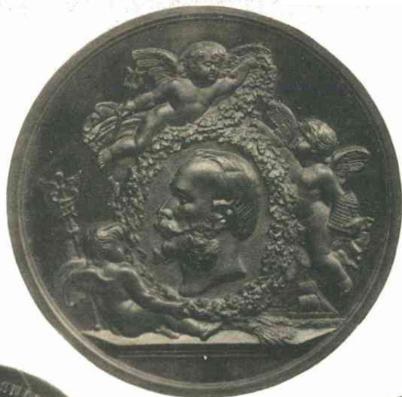
n o . 348.