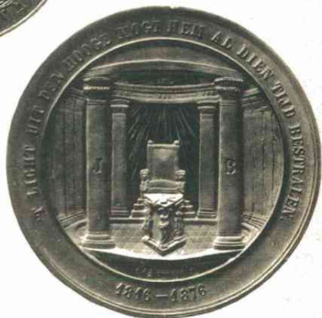
n o . 392.