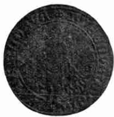
Neurenberger rekenpenning midden 16de eeuw

De derde is vermoedelijk iets jonger. Op de voorzijde ziet men den „Rechenmeister”, in alle deftigheid aan een reketafel gezeten, waarop een rekenbord met losse rekenpenningen. De keerzijde vertoont steeds de letters van het alphabet. De voorzijde is eene navolging van den legpenning van 1530 bij VAN MIERIS II, p. 330. 3 afgebeeld. Met C. F. GEBERT houd ik al deze exemplaren voor schoolpenningen, waarmede de kinderen leerden rekenen. In het schoolboek van JOH. AMOS COMENUS, Het portael der saecken en spraecken , Amst. 1673, komt in het 3de hoofdstuk bij het woord „rekenmeester” de vraag voor hoe deze rekende „en dat ofte met cijfferen ofte met rekenpenningen”, wat de kinderen in het latijn leerden vertalen met: idque vel Cifris, vel Abaculis (Calculis).