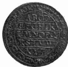
Neurenberger rekenpenning (begin 17de eeuw.)

Ook in de kwartiermeesterskamer op het Middelburgsche raadhuis trof men een afzonderlijke tafel aan, uit-