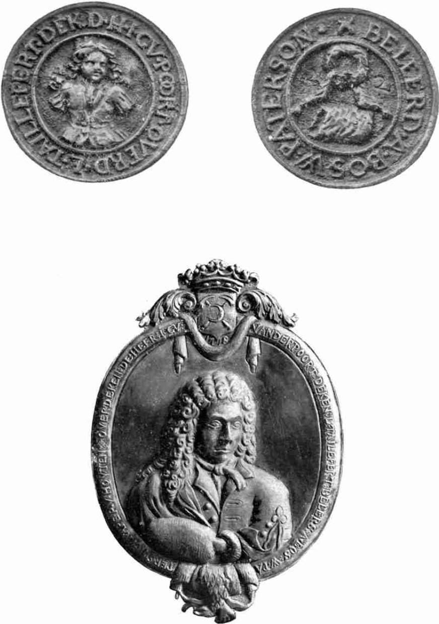
Penning en Schild van het voormalige Bont- en Paruyckmakersgilde te Middelburg.