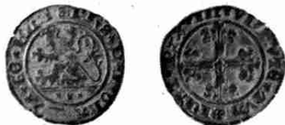
Half-vuurijzer Vlaanderen Philips

half-vuurijzer met zelfden leeuw, doch eenigszins anders geteekend: Deschamps de Pas, Revue Num. 1869-70, blz. 420-1, n o 5 (Pl. XIV, 3).