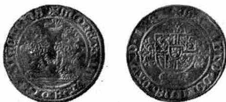
Dubbel-vuurijzer Utrecht 1482