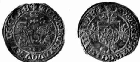
Dubbel-vuurijzer Gelre Maximiliaan