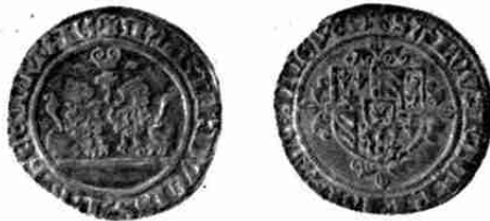
Dubbel-vuurijzer Vlaanderen 1480