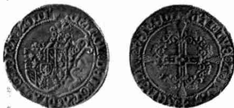
Vuurijzer Brabant 1475