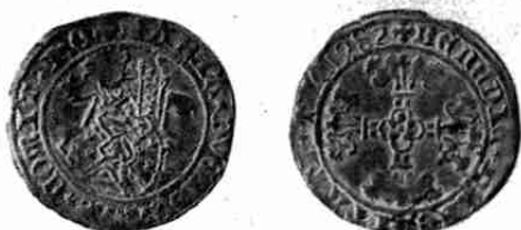
Vuurijzer Holland 1482

dubbel-vuurijzer — 1479-1482: van der Chijs, blz. 466-8 (Pl. XV, 1-8; XXXVII, 22-3).