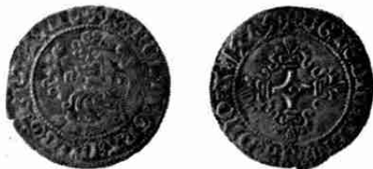
Half-vuurijzer Brabant 1475