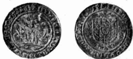
Dubbel-vuurijzer Holland 1479