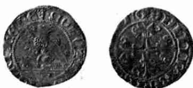
Half-vuurijzer Franeker 1485