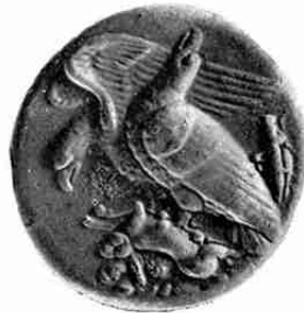
Valsche dekadrachme van Akragas