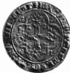
Gouden munten van Willem V van Holland (blz. 23)