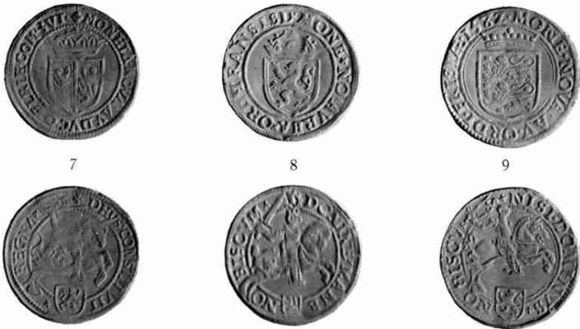
Gouden ridders van Gelderland, Overijssel en Friesland