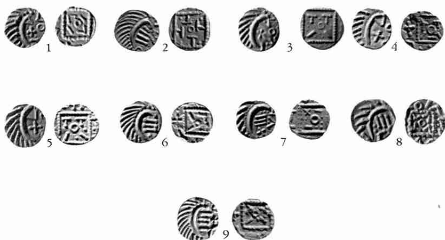
Hoard (Province of Groningen)