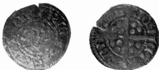
1½ × vergroot

Het onderhavige muntje vertoont op de voorzijde een ongekrond aanzienlijk hoofd waaromheen binnen twee parelcircels + R COMES FLANDRIE en op de keerzijde een lang glad kruis (type van na 1280) met in elk kwadrant drie bolletjes en binnen twee parelcirkels een randschrift luidende: MON-ETA-ARD-ENB.