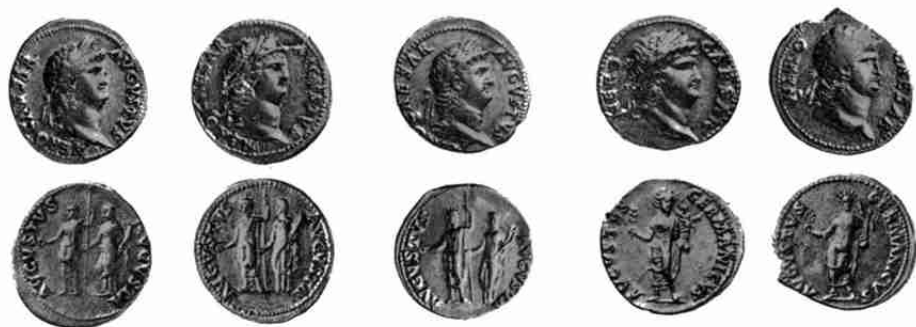
Nero 41 (3×), 42 (2×)