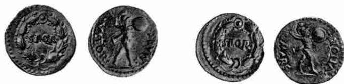
Burgeroorlog cf. 16 (2X)

De Romeinse muntvondst van het Domplein te Utrecht