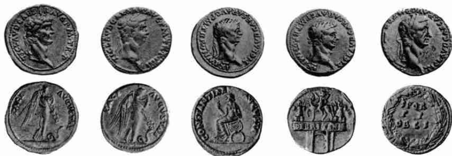
Claudius 26, 29, 3, 9, 42