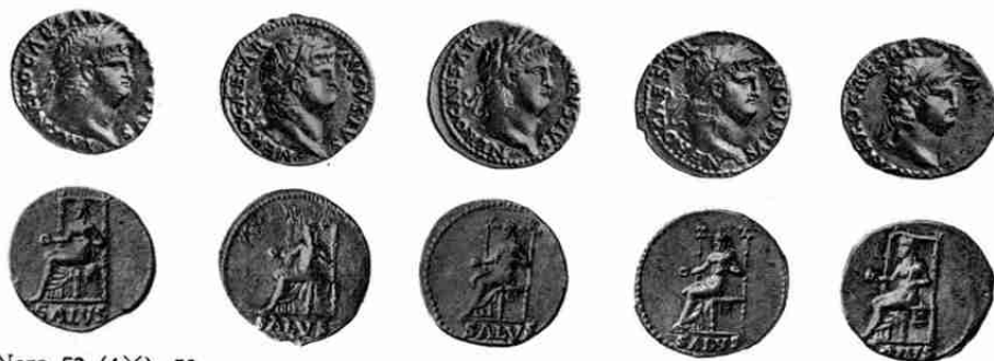
Nero 52 (4X), 53