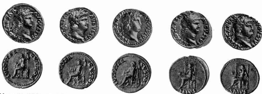
Nero 45 (3X), 52 (2X)