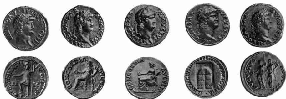
Nero 35, 43 (2×), 44, 41