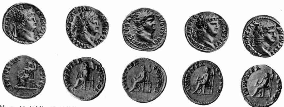
Nero 46 (2X), 45 (3X)