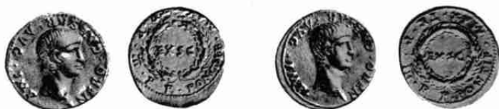
Nero 19 (2X)

De Romeinse muntvondst van het Domplein te Utrecht