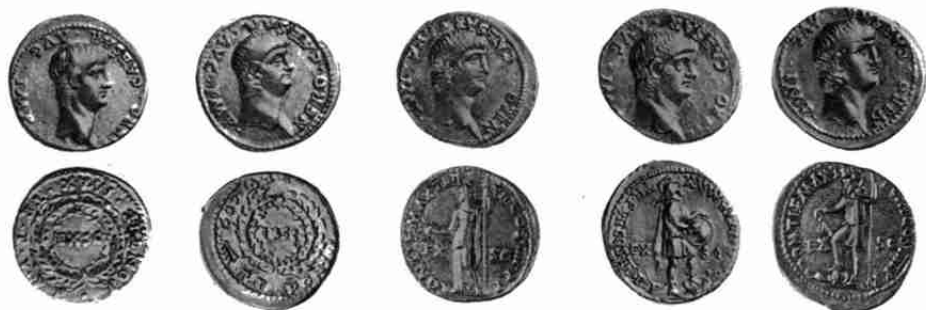
Nero 22, 24, 26, 28, 30