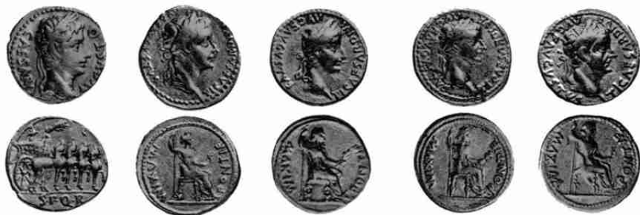
Augustus 293, Tiberius 3 (4X)