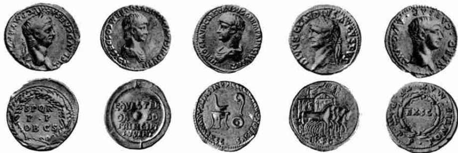
Claudius 45, 95, 98, Nero 1, 19