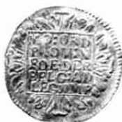
IV, type 1690 Zeeland 1690-1701 Holland 1709-1715 Westfriesland 1712-1719