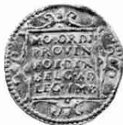
I, type 1586 alle provincies