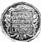
III, type 1673 Holland 1673 Overijssel 1676-1678