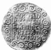
II, type 1672 Holland 1672-1716 Westfriesland 1684-1705