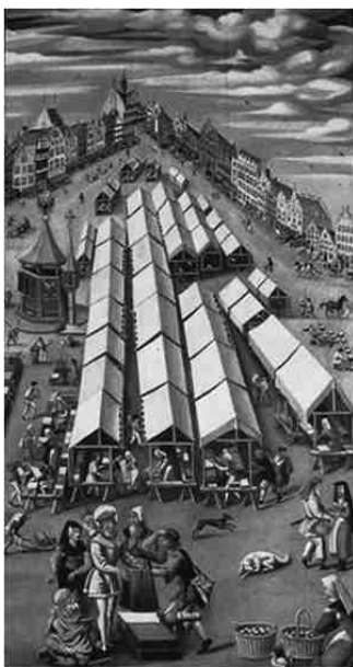
De lakenmarkt van 's-Hertogenbosch, bijna letterlijk op een steenworp afstand van de vindplaats. Anoniem, circa 1530.

kras door elkaar in de pot. De lap met 97 munten bleek op één navolging van een hollandse penning uit Gulik en een Brabantse dubbele paris van Jan II na uitsluitend Franse deniers te bevatten. Waarschijnlijk werd deze partij munten als laatste toegevoegd want de lap is min of meer bovenin aangetroffen. De gesproche is onderin de pot gevonden en blijkbaar als eerste gedeponerd.