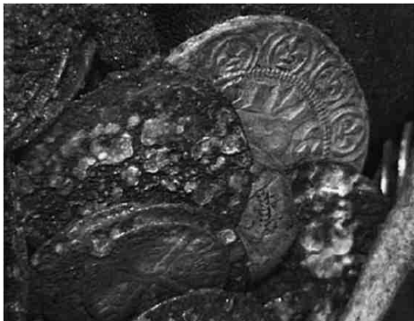
Inkijkje in de pot: munten met hoog en laag gehalte zilver