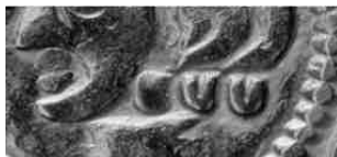
De drie boogjes aan de onderzijde van het haar

Het lange dubbele kruis op de keerzijdes van de in de vondst aangetroffen sterlingen is nagevolgd van Engelse sterlingen uit de tijd van Hendrik III en Edward I (1216-1272-1307). Het voorbeeld is aangemunt tot 1279, toen een nieuw type met een lang enkel kruis werd ingevoerd. Op het vasteland zijn in de laatste decennia van de 13 de eeuw enorme hoeveelheden navolgingen aangemunt: tegen het einde van de 13 de eeuw waren er van het nieuwe type zo'n