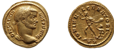
Afbeelding 1 – Diocletianus, aureus, Rome, ca. 290, gevonden te Espel

Een tweede vondst in de Polder is een aureus te Espel (afbeelding 1).