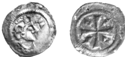
Herkomst: dr. Ulrich Klein