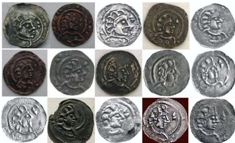
Figuur . Detail muntstempel vergelijking, type . a. Alleen de twee munten rechtsonder lijken qua borstbeeld afkomstig van dezelfde muntstempel.

Bij de stempelstudie heb ik alleen gekeken naar de vaste (onderzijde) muntstempel. Dit betreft de ‘numismatische’ voorzijde van de munt. Het met het oog vergelijken van de munten lijkt makkelijker dan het is. Zo kunnen munten meer of minder versleten zijn, evenals de muntstempels (door veelvuldig gebruik). Ook kunnen letters of symbolen opnieuw in de muntstempels gesneden zijn. Het is daarom van belang om bij het vergelijken te letten op meerdere elementen van de afbeeldingen op de munten.