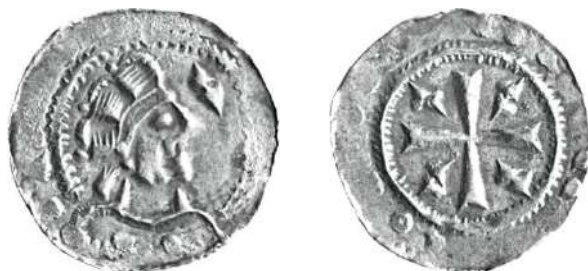
Herkomst: Vondst Turkije

Vz. Borstbeeld naar rechts met gravenmuts, binnen parelrand. Vóór het gezicht een schicht en op de borst twee punten of ringen. Pseudo-omschrift van punten of ringen afgewisseld door telkens twee driehoekjes (met de punt naar buiten gericht), binnen parelrand.