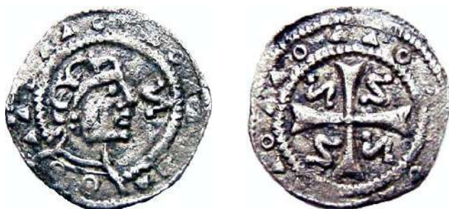
Figuur : Penning van het besproken type (variant . a)

Summary – The article draws on an inventory of specimens ( pennies and oboles) to establish the subtypes of a twelfth-century penny. Coin hoards and single finds point to count Floris III of Holland ( - ) as the mint authority and Egmond as the centre of production. A die study suggests a substantial degree of monetization in the twelfth century.