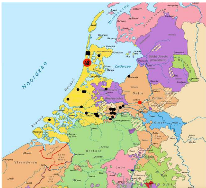
Figuur . Kaart met losse vondsten, schatvondst Arnhem (in rood) en een concentratie van losse vondsten in de regio Egmond (in rood).