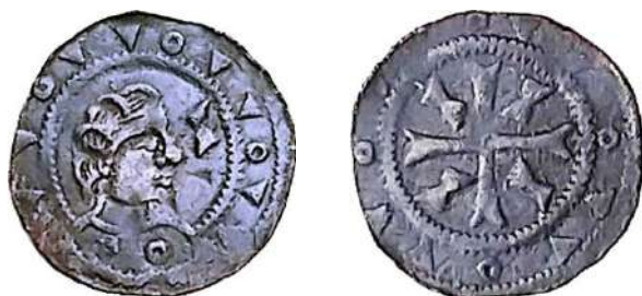
Herkomst: Vondst Schagen

Vz. Borstbeeld naar rechts met gravenmuts, binnen parelrand. Vóór het gezicht een schicht en op de borst twee ringen of gepunte ringen. Pseudo-omschrift van ringen afgewisseld door telkens twee driehoekjes (met de punt naar binnen gericht), binnen parelrand.